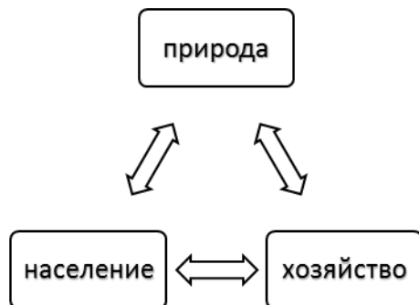
Рис. 1 Взаимосвязи в территориальной экономической системе «природа – население – хозяйство»

В отличие от традиционного подхода, построенного по схеме «природа – население – хозяйство», в центре внимания социально-географического исследования находится человек и условия его жизни, а затем – виды деятельности (экономика).